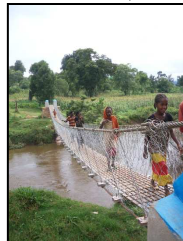
Ponte "Mons. M. Magrassi"

Per promuovere un cambiamento ed uno sviluppo dall'interno della società, lavorare nell'ambito dell'istruzione e della formazione è di capitale importanza. Siamo convinti che il vero cambiamento verrà non da strategie economico-finanziarie, ma dal cuore e dalla mente delle persone. Perciò devono procedere di pari passo l'evangelizzazione e l'istruzione. Occorre dare ai nostri giovani gli strumenti per avviare questo cambiamento. Il nostro motto è: "piuttosto che dare un paio di scarpe ad un bambino, è meglio dare l'Inglese a tutti" . Un paio di scarpe non cambia la vita a nessuno; l'istruzione certamente sì.